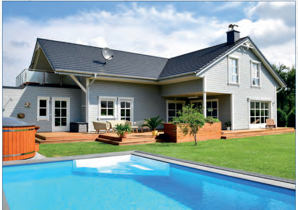
Die Abbildungen können Sonderausstattungen enthalten!