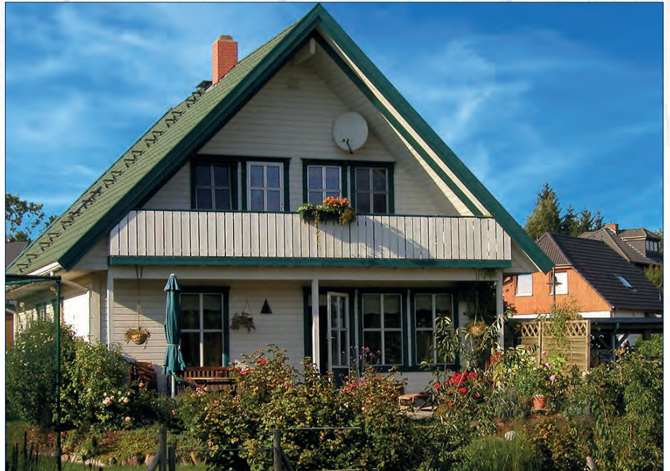
Die Abbildungen können Sonderausstattungen enthalten!